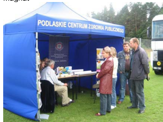
Zdjęcie 15 Badania lekarskie podczas festynu na Stadionie Gminnym