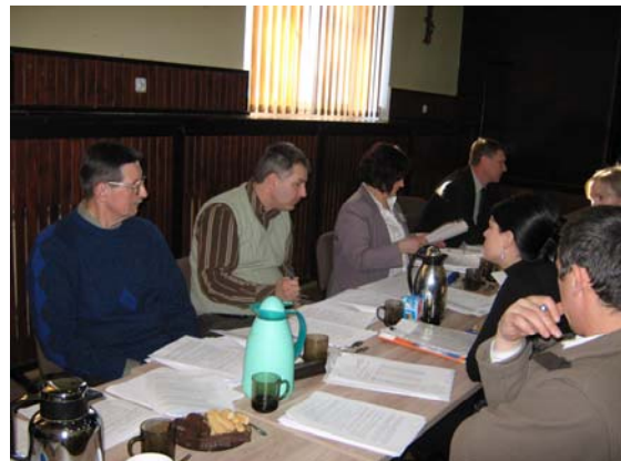
Zdjęcie 9 Posiedzenie komisji