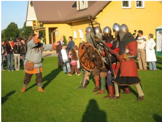
Zdjęcie 12 Festyn na Stadionie Gminnym

Realizacja działania przyczyni się do promocji miejscowości w Polsce i poza jej granicami dzięki transmisjom internetowym imprez, które odbywają się na terenie Ośrodka Sportu. Realizacja zadania pozwoli również na propagowanie zachowań prozdrowotnych wśród mieszkańców gminy. Realizacja działania stwarza możliwość promocji lokalnego sportu wiejskiego poprzez media elektroniczne na ogólnodostępnym forum.