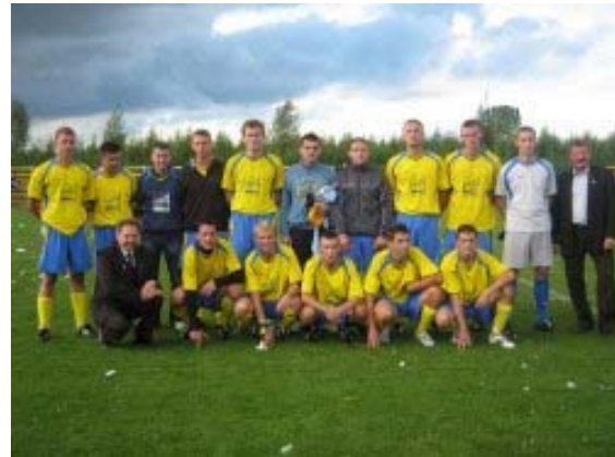
Zdjęcie 13 Miejscowa drużyna piłki nożnej Magnat