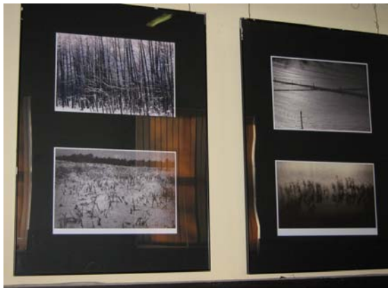
Zdjęcie 8 Wystawa zdjęć w Ośrodku Kultury

Realizacja zadań w ramach Planu Odnowy Miejscowości przyczyni się do polepszenia wizerunku miejscowości, pozwoli na promocję działań podejmowanych na terenie wsi i gminy przyczyniając się do polepszenia warunków życia lokalnej społeczności, rozwoju społeczno-kulturowego oraz pobudzenia aktywności sportowo-rekreacyjnej. Program ma służyć głównie integracji społeczności lokalnej i wzrostowi lokalnego patriotyzmu, rozwojowi organizacji społecznych, jak i zmniejszeniu problemów w sferze patologii społecznych.