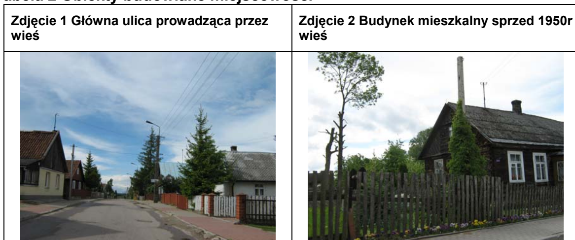
Tabela 2 Obiekty budowlane miejscowości

Po bogatej historii miejscowości nie pozostały żadne obiekty zabytkowe.