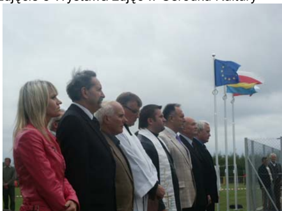
Zdjęcie 10 Festyn na Stadionie Gminnym